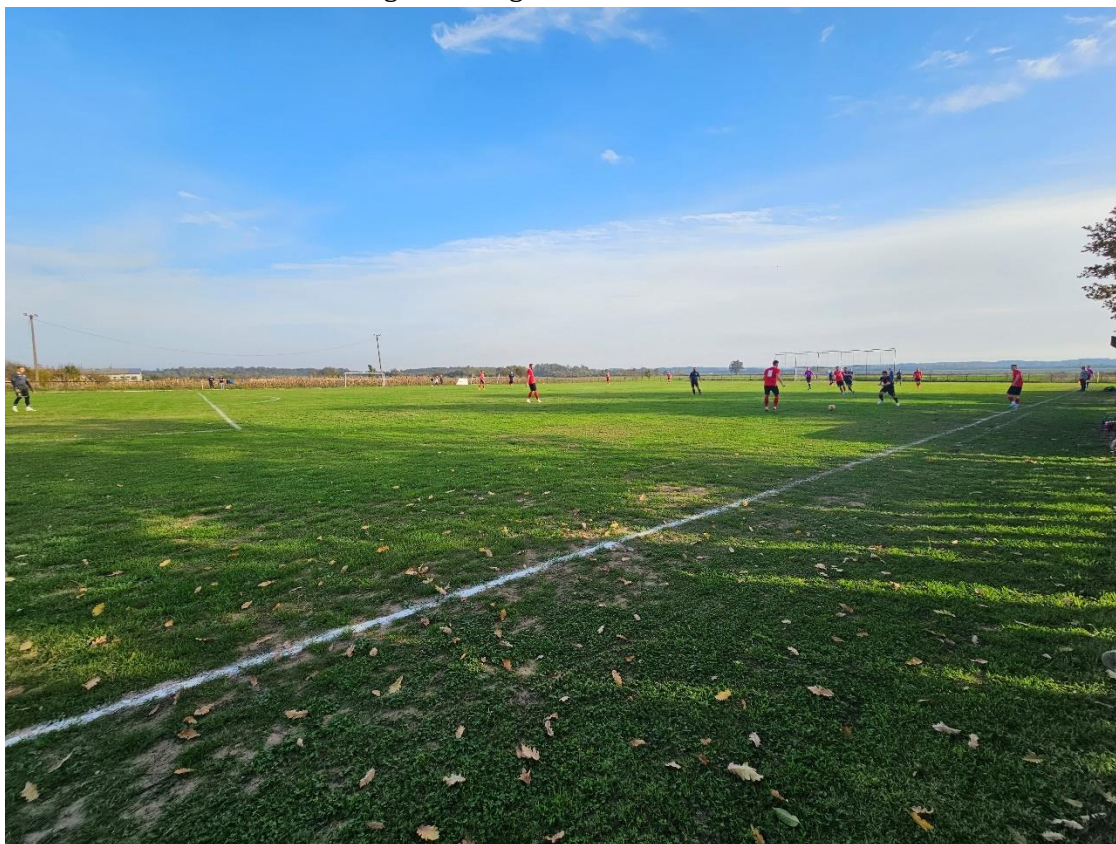
Slika 1. Nogometno igralište NK Bratstva Vranovci

Na području Općine Bukovlje nalaze se dva nogometna igrališta u vlasništvu Općine Bukovlje; nogometno igralište NK Slavonca Bukovlje i nogometno igralište NK Bratstva Vranovci.